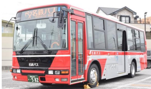
名鉄電車9500系デザインの特別塗装バス